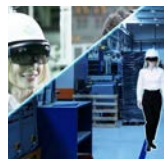
XR設備メンテナンス