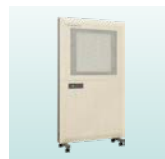
クリーンパーテーション