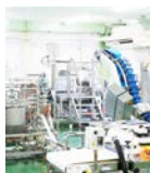
安曇野デモサイト